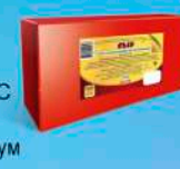
Сыр «Голландский брусковый»

МДЖ 45% 150 суток от 0 до +4 °С 4 кг 4 шт