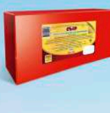
Сыр «Голландский Классик»

МДЖ 35%, 45% 150 суток от 0 до +4 °С 4 кг 4 шт