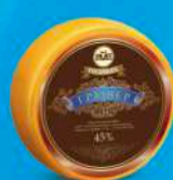
Сыр «Грювер особый»

МДЖ 45% 120 суток от 0 до +4 °С 8 кг 2 шт