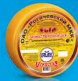
Сыр «Монастырский дар»

МДЖ 35%, 45% 135 суток, 150 суток от 0 до +4 °С 8 кг 2 шт