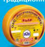
Сыр «Российский Традиционный»

МДЖ 35%, 45% 150 суток от 0 до +4 °С 8 кг 2 шт