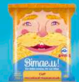
Сыр «Российский Традиционный»

МДЖ 45%, 50% 150 суток от +2 до +6 °С Нарезка – брусок, МГС 200 г 30 шт