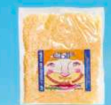
Сыр «Голландский Классик»

МДЖ 45% 120 суток от 0 до +4 °С Нарезка – тертый, вакуум 200 г 11 шт