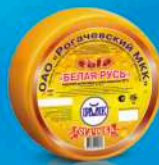
Сыр «Белая Русь»

МДЖ 45% 150 суток от 0 до +4 °С 8 кг 2 шт