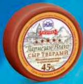
Сыр твердый «Пармезан Bravo»

МДЖ 45% 360 суток от 0 до +4 °С 8 кг 2 шт