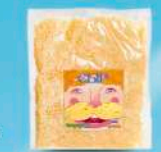
Сыр «Российский Традиционный»

МДЖ 45%, 50% 90 суток от -4 до +4 °С Нарезка – тертый, вакуум 200 г 11 шт