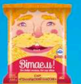
Сыр «Голландский Классик»

МДЖ 35%, 45% 150 суток от +2 до +6 °С Нарезка – брусок, МГС 200 г 30 шт