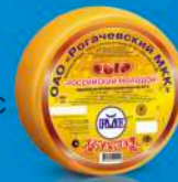
Сыр «Российский молодой»

МДЖ 45% МДЖ 50% 150 суток от 2 до +6 °С от 0 до +4 °С 8 кг 2 шт