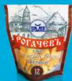
Сыр твердый «Пармезан Bravo»

МДЖ 45% 360 суток от 0 до +4 °С вакуум 100 г 12 шт