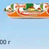
Сыр плавленный «Хуторок»

МДЖ 45% 150 суток от 0 до +6 °С п/пленка от 150 г до 300 г 40 шт