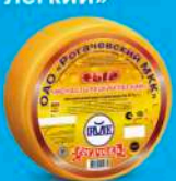
Сыр «Монастырецкий легкий»

МДЖ 35% 150 суток от 0 до +4 °С 8 кг 2 шт