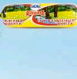
Сыр плавленный «Ручеек»

МДЖ 40% 150 суток от 0 до +6 °С п/пленка от 150 г до 300 г 40 шт